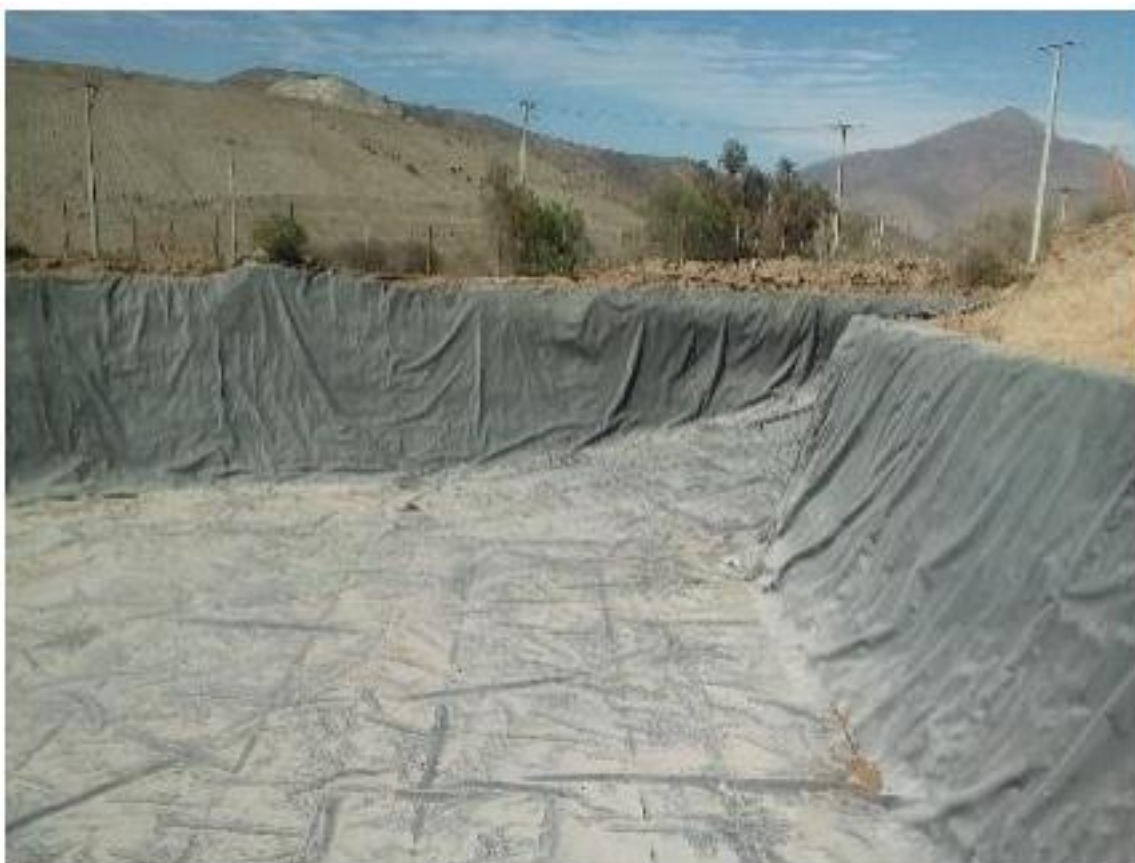
Imagen N°1: Vista de Piscina de Aguas Contactadas desde el fondo hacia el acceso